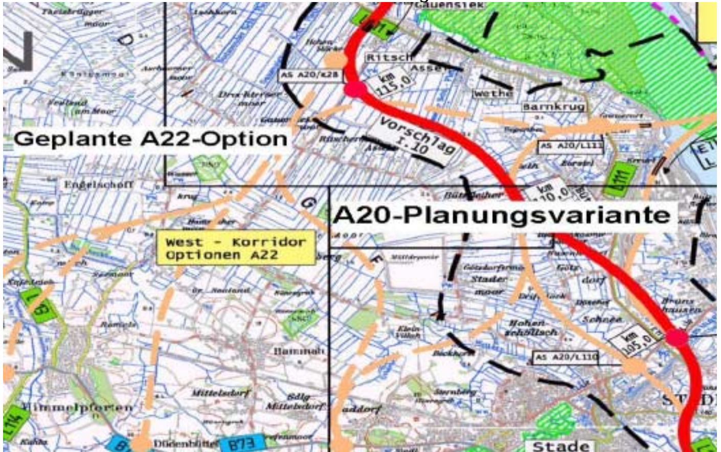
Karte A20- Raumordnungsverfahren

uns in der Stellungnahme auf den Tunnelbereich und die Strecke zwischen Drochtersen und Stade beschränkt. Als direkt Betroffene (einige BI-Mitglieder werden die Autobahn sehr nahe erleben) und als anliegende Gebiete“ werden wir massiv durch Lärm, Abgase und Umweltzerstörungen (z.B. auf die Mooregebiete) betroffen sein. Außerdem ist der Elbtunnel der Vorbote für die A22. Wir engagieren uns deshalb intensiv im Rahmen des ROV. Hierbei werden für die Zukunft weichenstellende verfahrensrechtliche Entscheidungen getroffen.